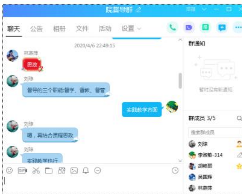
图1 服装设计学院院督导群

设计学院的领导们勇于担当、身先士卒，校、院两级督导也积极认真的参与其中，为了能够更好地为教学质量保驾护航，学院专门建了一个QQ群，大家在群里分享经验、讨论实践教学与督导方法、为教学献计献策。