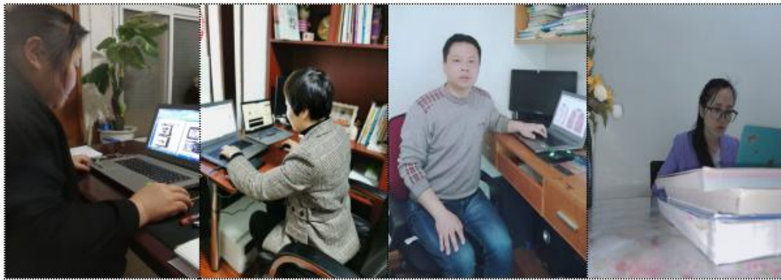
图2 服装设计学院院督导副教授团队