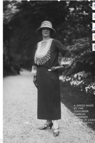
江西服装学院 JIANGXI INSTITUTE OF FASHION TECHNOLOGY

1908年：“高级时装”这个词第一次使用。 1921年：法国新闻界创建了PAIS（保护工业艺术家协会），以保护个人高级时装设计免受盗版。设计被拍摄在人体模型，正面，背面和侧面，并注册为证据。