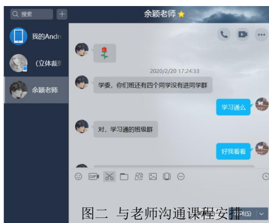
图二 与老师沟通课程安排