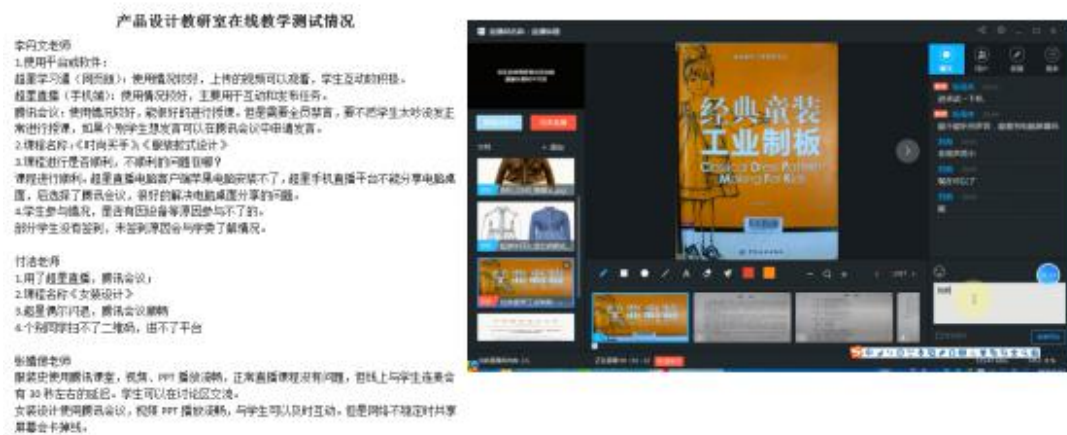
图3 产品设计教研室在线教学测试情况

学前在线教学测试，以便发现问题并及时解决问题，对于在线教学中出现的突发性问题要求教师做好备用方案，以确保在线教学的顺利开展。